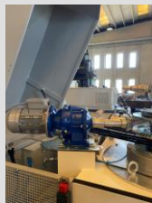
Gruppo pulizia fango