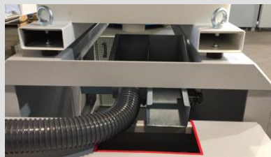
Scambiatore acqua chiarificata