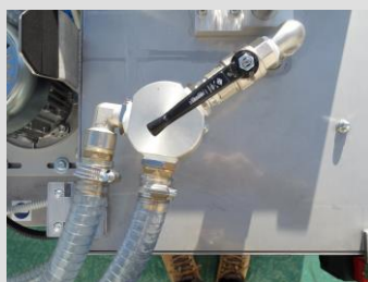
Ingresso a due vie acqua torbida