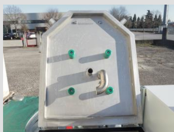
Dispositivo di sicurezza