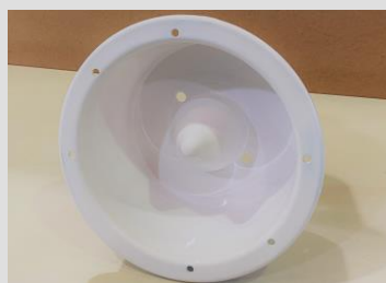
Cestello in termoformatura per lo scarico del fango